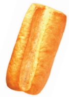
Exceso de levado